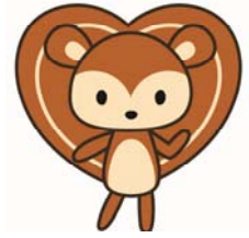
キャラクター[まもりす]

地盤保証制度は、登録地盤会社の皆様が、まもりすまい保険の届出事業者の皆様に対して行う「地盤保証」を保険でサポートするしくみです。住宅保証機構が、引受保険会社と保険契約（地盤にかかる生産物賠償責任保険）を結び、地盤調査または地盤補強工事の瑕疵により、住宅が不同沈下した場合、登録地盤会社に補修費用の一定割合を保険金としてお支払いします。